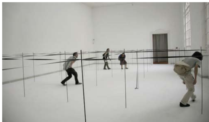
Mona Vatamanu & Florin Tudor, Land Distribution , 2012 Installation à Mucsarnok Kunsthalle, Budapest, 2010 Collection FRAC Lorraine © Mona Vatamanu & Florin Tudor