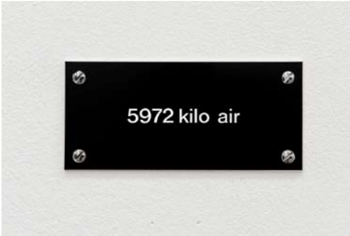
Hans Schabus, IAC , 2011 Collection de l'Institut d'art contemporain, Rhône-Alpes