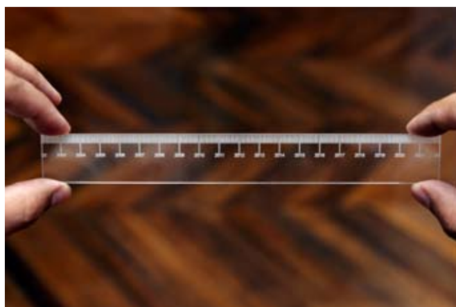
Cevdet Erek, Ruler Near , 2011 Vue de l'exposition Outre mesure et programmes radio à La Galerie, Centre d'art contemporain de Noisy-le-Sec Production de La Galerie