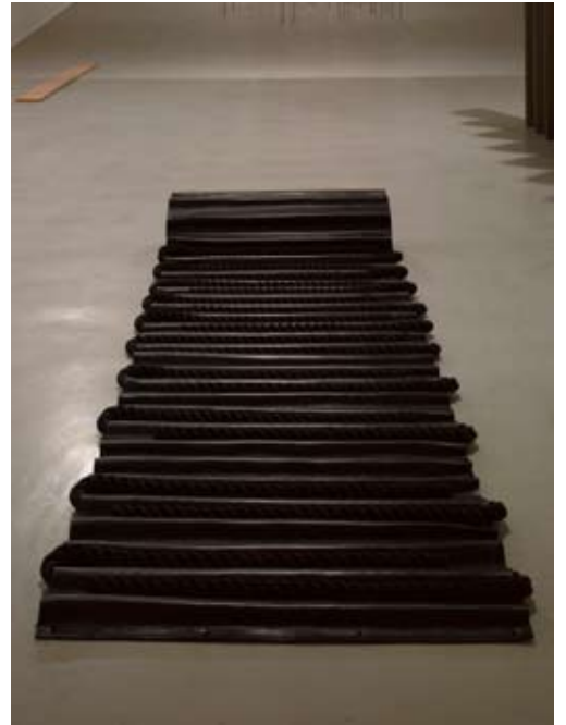
Leonor Antunes, A spine-wall suppressed all draughts , 2008.