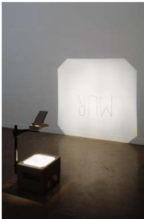
Joëlle Tuerlinckx, MUR , 1999 Collection FRAC Champagne-Ardenne, Reims © Joëlle Tuerlinckx