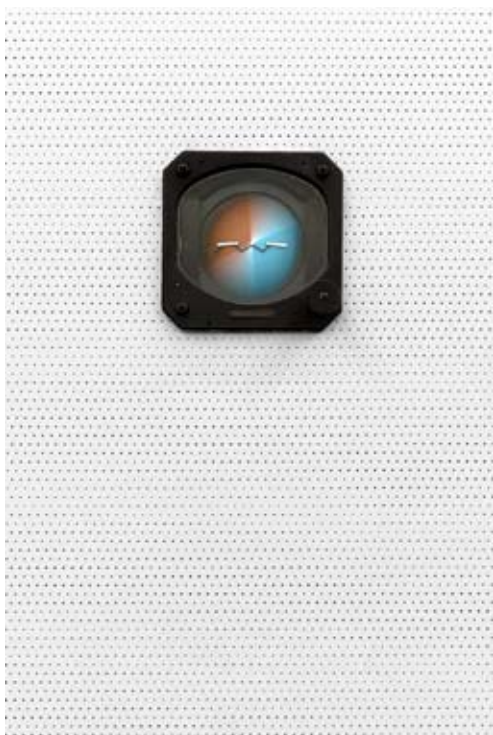
Evariste Richer, L'œil du perroquet , 2008 Collection de l'Institut d'art contemporain, Rhône-Alpes